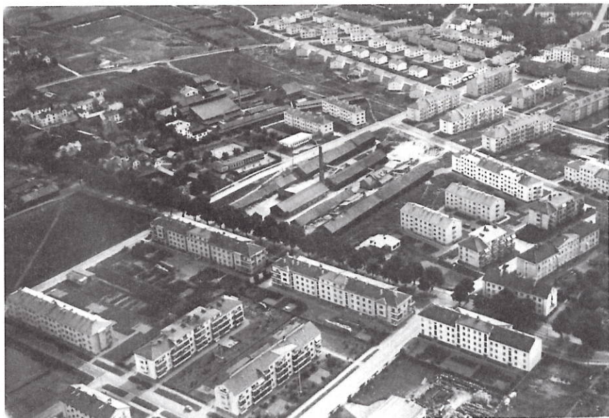
Norra och södra Kvarngärdet med tegelbruken, 1947.