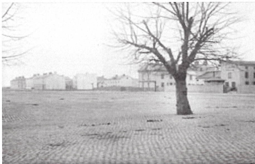
Vaksalatorg från norr 1901