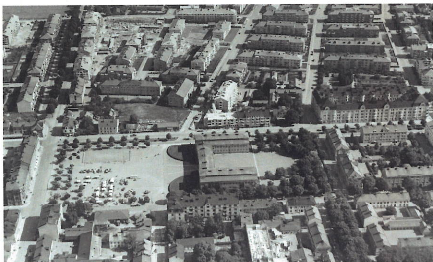
På bilden syns i förgrunden Vaksalatorg och Vaksalaskolan. Längst upp till vänster: våra hus Vaksalagatan 43 och 47. På gården pågår uppförandet av Eskilsgatan 8