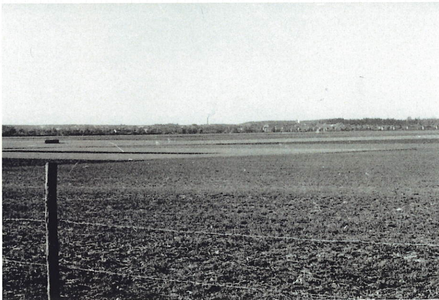
Kvarngärdet, innan det bebyggt. Bilden tagen mot norr om våra hus på Vaksalagatan