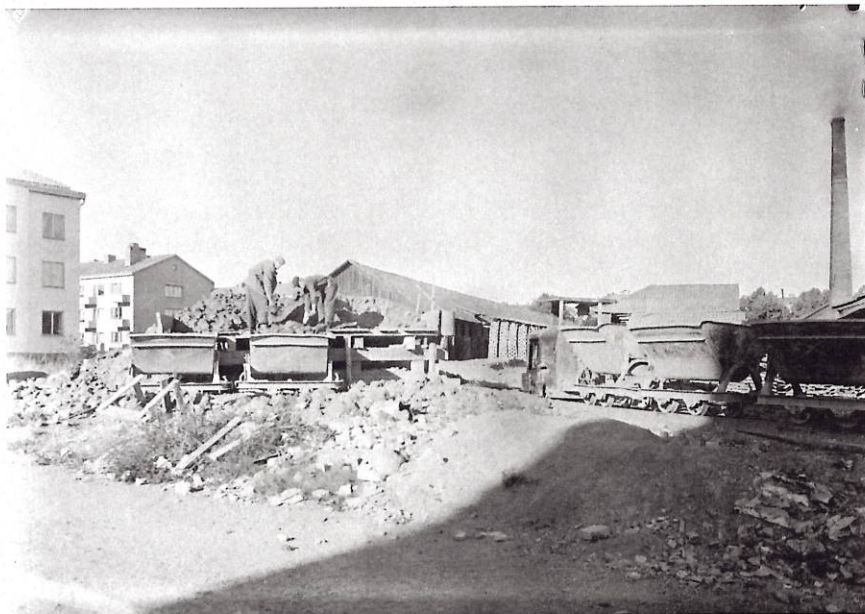
Waksala Tegelbruk i kvarteret Håkan, nedlagt 1948.

I kvarteret Håkan där våra hus skulle komma att byggas låg sedan 1897 ett tegelbruk, Waksala tegelbruk.