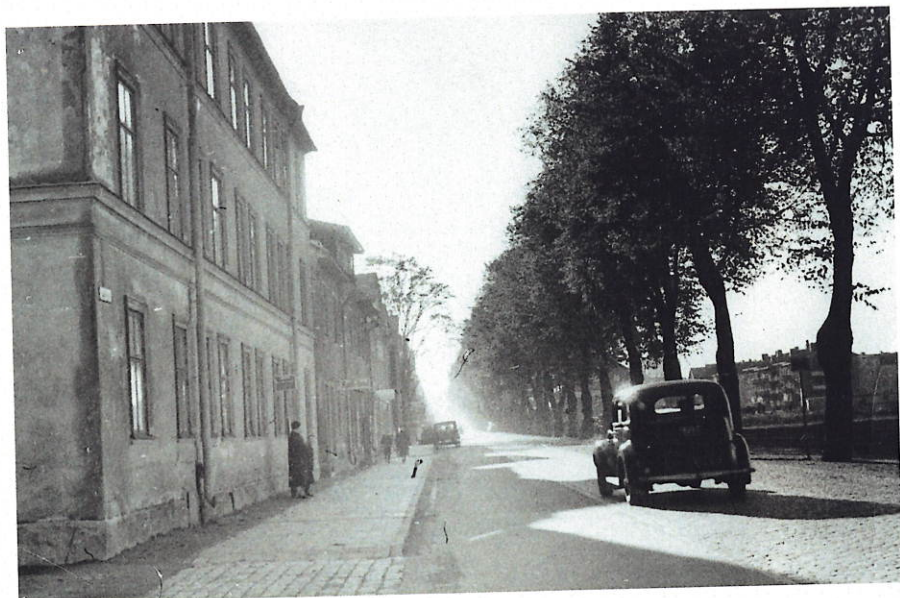
Vaksalagatan från förr västerut.