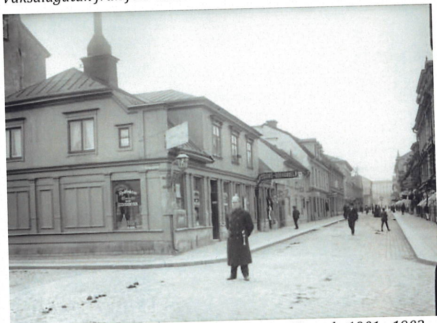
Vaksalagatan - Kungsgatan, Dragarbrunn, Uppsala 1901 - 1902